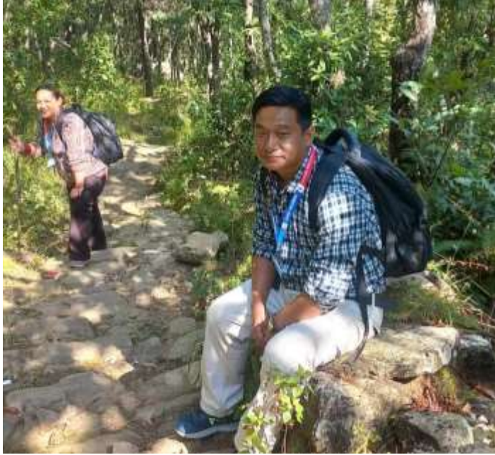
परिवार स्वास्थ्य प्रोफाइल @ बागलुंग

अंक १६६, वर्ष ५, २०८० कार्तिक २६, November 12, 2023 आइतबार